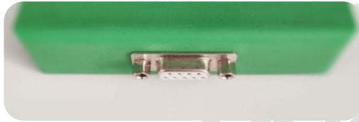
图 2 传感器接口