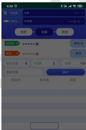
请选择设备 (设备搜索中)

在该界面上会列出当前所搜索到的测力仪列表，手机“选择框”选取相应的测力仪，等待上端蓝牙连接显示“蓝牙已连接”，表示仪表与移动显示端已配对连接成功，如下图：