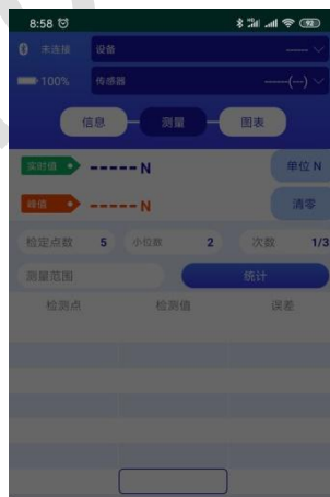
请选择设备 (设备搜索中)