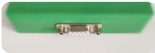
图 2 传感器接口